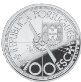
Diogo Cão Autor: Paulo Guilherme d'Eça Leal