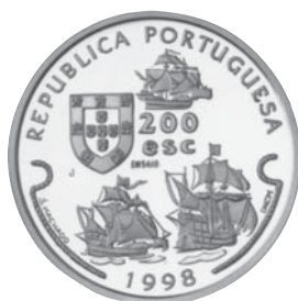
Vasco da Gama