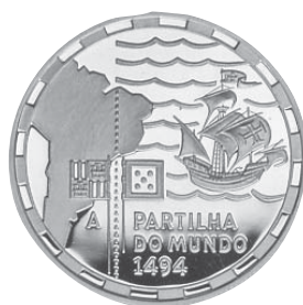
A Partilha do Mundo Autor: António Marinho