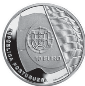
Data do Decreto 2007 Comemoração Campeonato do Mundo de Vela Olímpica €10,00 Prata Autor: João Duarte