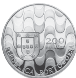
Data do Decreto 1992 Comemoração Presidência Portuguesa da Comunidade Europeia 200$00 Cuproníquel Autores: Isabel Carriço e Fernando Branco