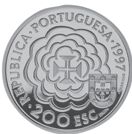
Irmão Bento de Góis Autores: Isabel Carriço e Fernando Branco