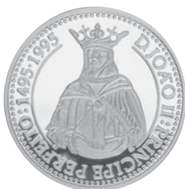
D. João II - O Príncipe Perfeito Autor: Eloísa Byrne