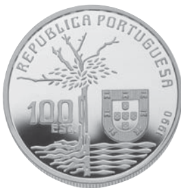
Data do Decreto 1990 Comemoração Centenário da Morte de Camilo Castelo Branco 100$00 Cuproníquel Autor: Irene Vilar