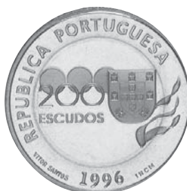
Data do Decreto 1996 Comemoração XXVII Jogos Olímpicos Atlanta 1996 200$00 Bimetálica Autor: Vitor Santos