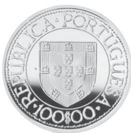
Bartolomeu Dias