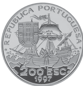
São Francisco Xavier Autor: Eloísa Byrne