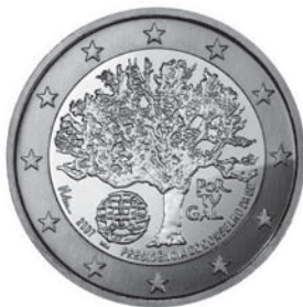
Data do Decreto 2007 Comemoração Presidência Portuguesa no Conselho da União Europeia €2,00 Bimetálica Autores: Luc Luycx / Irene Vilar