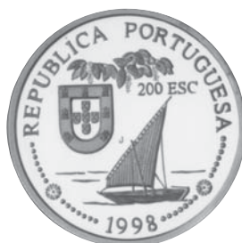
Chegada à Índia Autores: Isabel Carriço e Fernando Branco