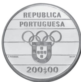
Data do Decreto 1992 Comemoração XXVI Jogos Olímpicos Barcelona 1992 200$00 Cuproníquel Autor: António Marinho