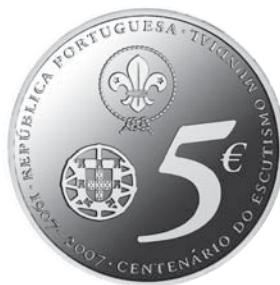
Data do Decreto 2007 Comemoração Centenário do Escutismo Mundial €5,00 Prata Autor: João Calviño