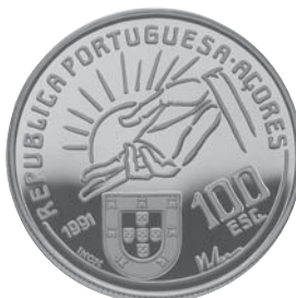
Data do Decreto 1991 Comemoração Centenário da Morte de Antero do Quental 100$00 Cuproníquel Autor: Irene Vilar