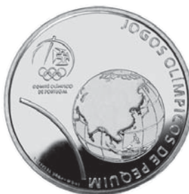
Data do Decreto 2008 Comemoração Jogos Olímpicos de Pequim €2,50 Prata Autor: José Teixeira