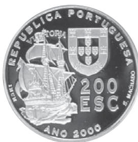
Fernão de Magalhães Autor: Raúl de Sousa Machado