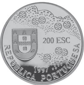
Padre Luís Fróis