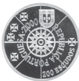
Terra Florida Autor: António Marinho