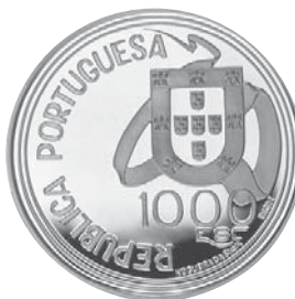
Data do Decreto 1994 Comemoração 5.º Centenário do Tratado de Tordesilhas 1.000$00 Prata Autor: Vítor Nogueira da Silva