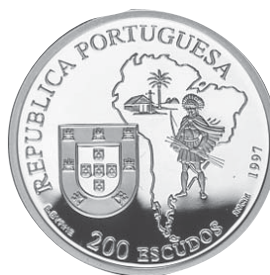
Beato José de Anchieta Autor: Raul de Sousa Machado