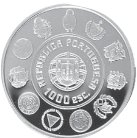
Data do Decreto 2000 Comemoração IV Série Ibero-Americana O Homem e o Seu Cavallo – Cavallo Lusitano 1.000$00 Prata Autor: Vitor Santos