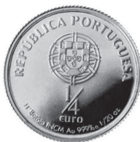
Data do Decreto 2007 Comemoração Série Portugal Universal – Santo António ¼ Euro Ouro Autor: Helder Batista