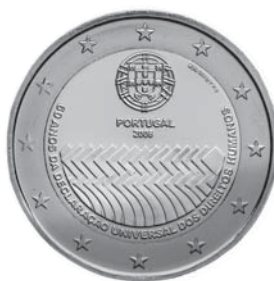
Data do Decreto 2008 Comemoração 60.º Aniversário da Declaração Universal dos Direitos Humanos €2,00 Bimetálica Autores: Luc Luyx / João Duarte